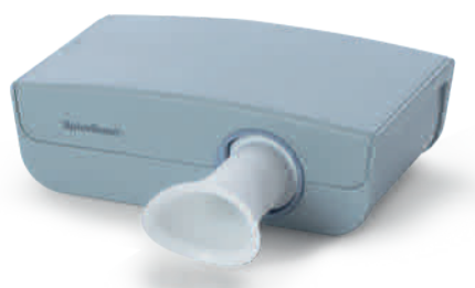
Ultrasound spirometri SpiroScout SP plus